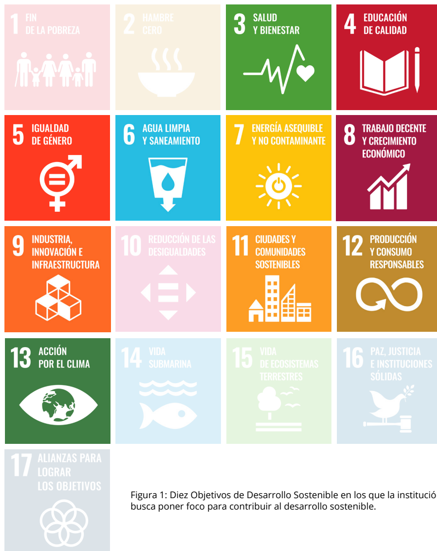
Figura 1: Diez Objetivos de Desarrollo Sostenible en los que la institución busca poner foco para contribuir al desarrollo sostenible.

Desde tal perspectiva y considerando el quehacer institucional, se han seleccionado 10 de los 17 ODS (figura 1), con el objeto de alinear y operacionalizar nuestra contribución a los territorios. Esta no es una medida restrictiva, sino que es más una recomendación para ir avanzando con más fuerza a un grupo de enfoque que hoy, la institución plantea con mayor énfasis. Dicha definición de Objetivos de Desarrollo Sostenible foco, responde al grado de contribución que una institución de educación superior puede realizar en el territorio, desde el despliegue de sus capacidades y desde las redes de asociatividad en la cuales participa.